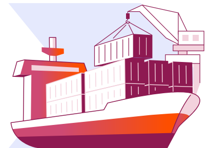
Destinatários finais (no transporte marítimo)