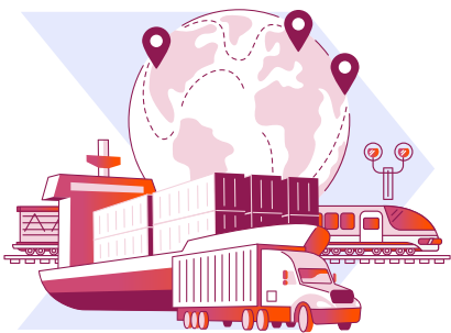
Transportadores que operam nas vias marítimas e interiores, rodoviárias e ferroviárias