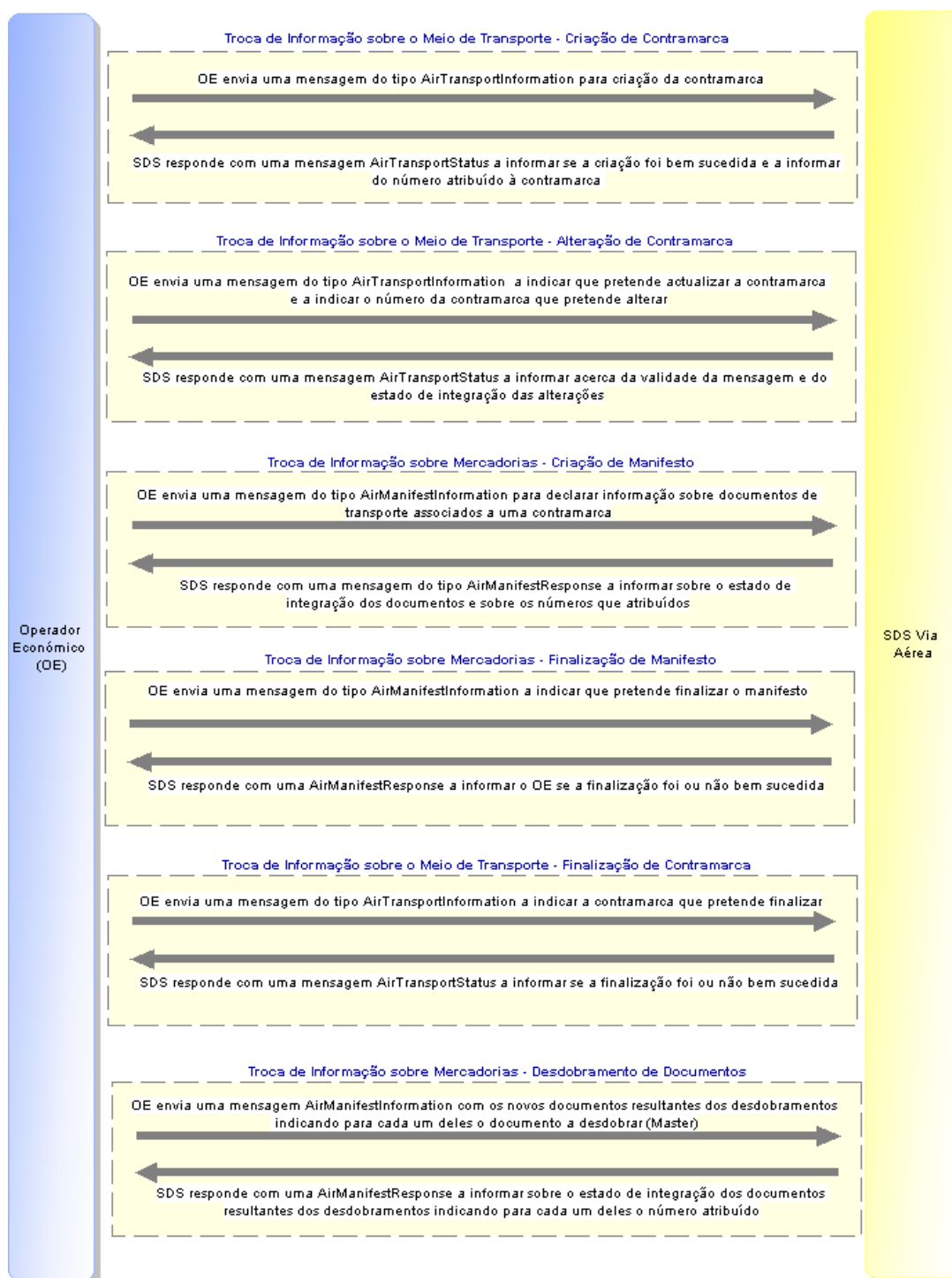
Imagem 1 – Troca de mensagens entre SDS Via Aérea e Operadores Económicos

Este capítulo especifica as mensagens utilizadas no diálogo entre os Operadores Económicos e o SDS Via Aérea, para tratamento da declaração de dados referentes ao Processo Meio de Transporte e ao Processo de Mercadorias.